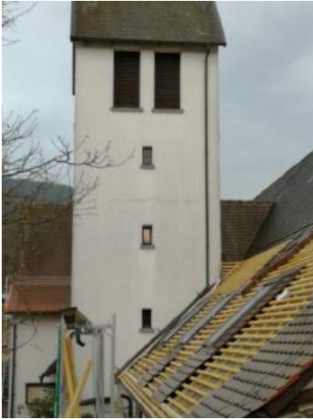
Das Dach - frisch gedeckt mit Lichtöffnungen