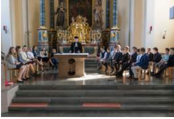
Konfirmanden in großer Prüfungsrunde