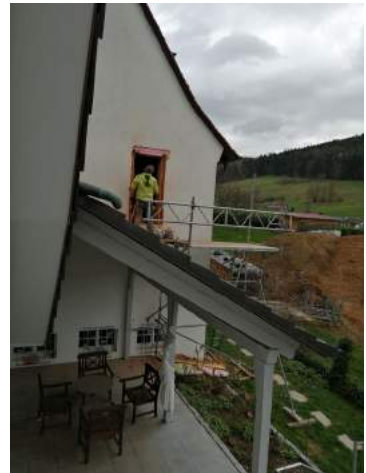
Öffnung für das Altarfenster mit Kreuz

noch vieles zu bedenken. Wir sind aber auf gutem Weg und werden in der nächsten Ausgabe wieder einen Rundgang mit Ihnen durch unsere Baustelle machen.