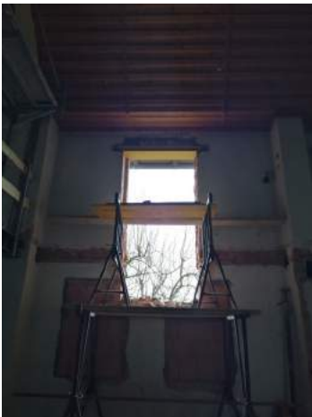
Neues Zuhause für das Packwitz-Fenster

Das vordere Packwitz-Fenster im Altarbereich hat seinen Umzug mit Bravour gemeistert. Da wir im Altarbereich ein Fenster mit einem Kreuz bekommen, wurde das Altarfenster frei.