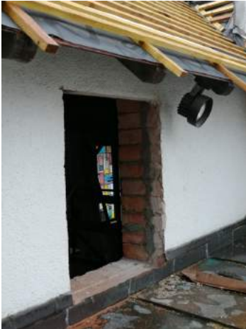
Lichtdurchbruch über dem Eingang

zel, die gleichzeitig auch ein Ambo ist, werden aus verschiedenen Hölzern gearbeitet sein. Wir wollen uns in Zukunft beim Abendmahl um den Altar versammeln können. Er wird in der Mitte stehen, leicht und doch würdig.