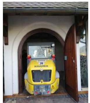
Schweres Gerät rückt an

Das Holzkreuz wird einen neuen Platz im Kloster-teil des Seelbacher Rathauses bekommen. Welch