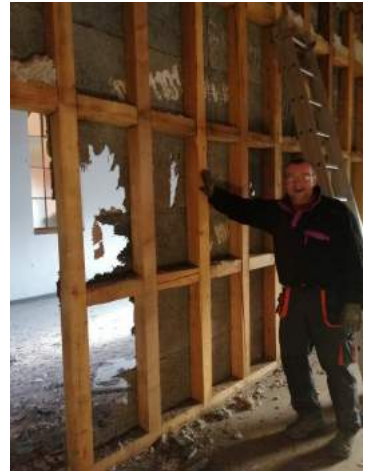
So sieht die Kirche im Innern aus - die Wand zum Pfadfinderraum hinter der Orgel